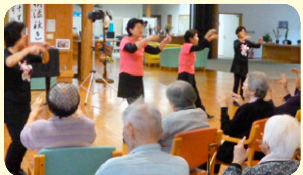
球磨郡レクリエーション協会様 (偶数月)