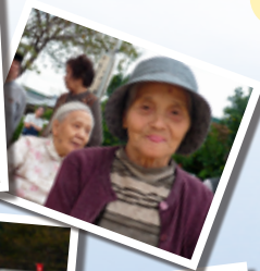
岩野小学校交流会(10月4日)