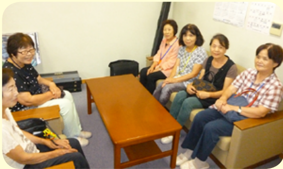
傾聴ボランティア様 (毎月)