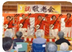
錦町ボランティア