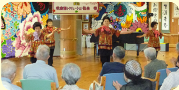
球磨郡レクリエーション協会様 (隔月)